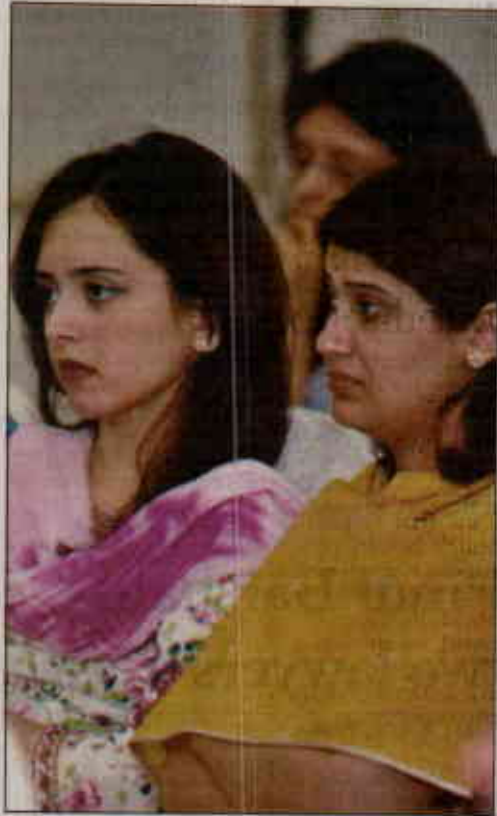
ISLAMABAD: Participants of a workshop on the Telecom Regulatory Environment Assessment and Teleuse at the Bottom of the Pyramid.