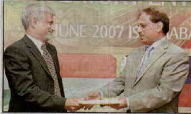
اسلام آباد (ایکسپریس نیوز) پاکستان ٹیلی کام ریگولیٹری اتھارٹی کے چیئرمین جمیز مین بی بی اے (دائیں) نے وزیراعظم یاسین نے ورکشاپ کے دوران ٹیلی کمیونیکیشن کے نامزد کنندہ کو تحفہ دے رہے ہیں