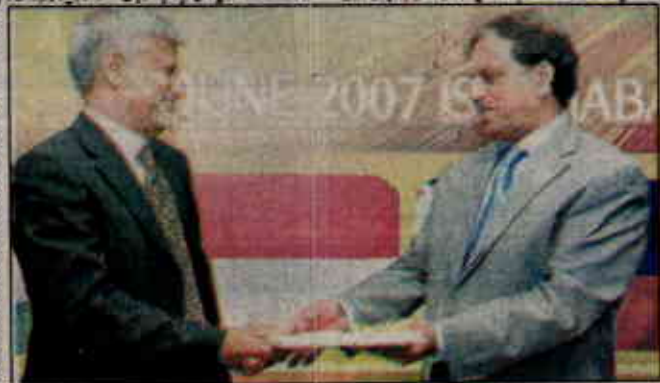
اسلام آباد، پشاور میں پی ٹی اے پشاور اور عالم اسلام آباد ریگولیٹری اتھارٹی کے چیئرمین اور نائب سربراہ کو سونپتا ہے۔

پاکستان میں ٹیلی کومنیٹیٹیشن ورکس میں ہر ماہ اوسطاً تقریباً 23 لاکھ صارفین کا اضافہ ہوتا ہے۔ پشاور اور عالم اسلام آباد (ہوسٹنگ سرسٹریکچر) پاکستان ٹیلی کام ریگولیٹری اتھارٹی کی طرف سے جاری کیے گئے ریگولیٹری ماحول ان ممالک سے ابھرے۔ ان ممالک کا اعلان ٹیلی کام سے متعلق تحقیق کرنے والے آزاد ادارے نے ایشیا کی جانب (ہائی ملٹی 7 پیر 94) اور پاکستان میں ہوا کی گئی۔