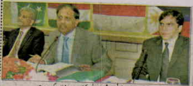
اسلام آباد: چیرمین پی ٹی اے شہزادہ عالم ورکشاپ سے خطاب کرتے ہیں