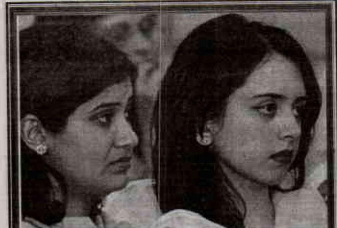
اسلام آباد، شہلی کام ریگولیشنری انوائزمنٹ اسٹیمٹ کے زیر اہتمام دو کتاب میں شریک دو خواجہ

اسلام آباد (پاکستان) شہلی کام ریگولیشنری انوائزمنٹ میں ممالک دنیا کی سرکاری دکان اور ملک سے آگے اور پاکستان میں موبائل نمبر کی پیشگی کے لئے ریگولیشنری ماحول کے ممالک سے بھرے اس بات کا اعلان شہلی کام سے متعلق تحقیق کرتے وقت آزاد ممالک