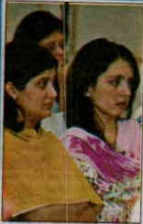
Participants attending the workshop on Telecom Regulatory Environment Assessment and Teleuse at the Bottom of the Pyramid in Islamabad on Thursday.